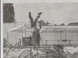
Pas de temps à perdre... On répète dès qu'on peut et où l'on peut.

Du 22 au 24 avril , site du Grand-Pré, Languieux. Tarifs : sur 17 spectacles, une dizaine sont gratuits. Les autres : de 6 à 14 €. Ce vendredi, 19 h, Baltringue , tout public (gratuit) ; puis à 21 h, quatre spectacles dans le chapiteau jaune. Programme complet : www.galapiat-cirque.fr