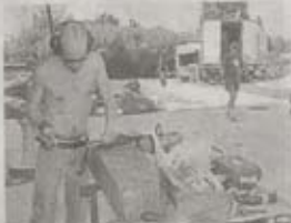
Des ateliers à ciel ouvert ont été installés afin de fabriquer les décors.