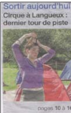
Sortir aujourd'hui Cirque à Languieux : dernier tour de piste

Les 22, 23 et 24 avril , espace chapiteaux, parc du Grand-Pré, à Languieux. Tarifs : de 6 à 14 €. Des spectacles sont aussi gratuits comme le bal du dimanche soir, atelier terre et la briqueterie, le dimanche, l'apéritif concert du samedi, le spectacle théâtre, le samedi aussi, etc. Possibilité de se restaurer sur place. Renseignements : tél. 02 96 52 60 60.