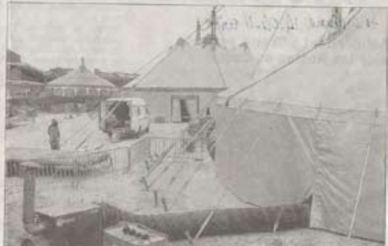
Trois chapiteaux ont été montés dans le parc du Grand Pré. L'un pouvant accueillir 400 spectateurs, le second, 200, le dernier étant affecté à la restauration du public et des artistes.

Accueillir un festival de cirque, cela ne s'improvise pas. Depuis une semaine, organisateurs et bénévoles s'activent pour monter les chapiteaux dans le parc du Grand Pré.