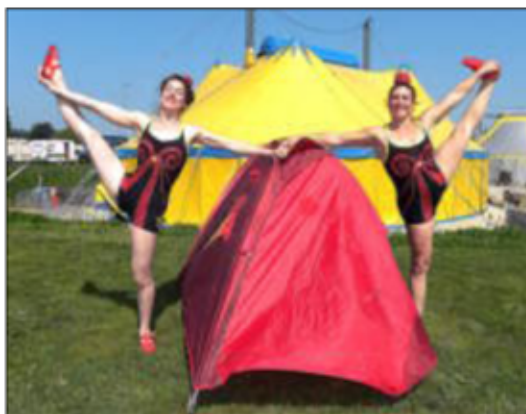
Les deux artistes des Fées Raillieuses proposent, demain, un spectacle d'acrobaties teinté d'humour.

Le festival de cirque Tant qu'il y aura des Mouettes a débuté hier. 80 artistes sont à découvrir, notamment les Fées Raillieuses, demain.