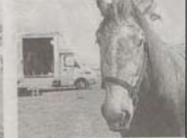
Tango portera le ou la cavalière pour un numéro de voltige.