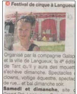
Festival de cirque à Languieux Organisé par la compagnie Galapiat et la ville de Languieux, la 4 e édition de Tant qu'il y aura des mouettes s'achève dimanche. Spectacles de clowns, voltige équestre, spectacle de rue... et bal dimanche soir. Samedi et dimanche , site du Grand-Pré, Languieux. Gratuit.