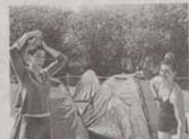
Le duo burlesque de la compagnie lilloise les Fées Raïlleuses.