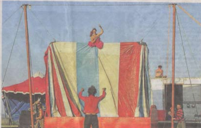
Lorsqu'il ne sort pas en piste, on peut voir les artistes s'entraîner un peu partout autour du Pré aux étoiles.

Dés spectacles gratuits, jeux et animations garantissent aux festivaliers de passer une agréable journée en famille. La compagnie les Fées Raillieuses de Lille donnera le coup d'envoi à 11 h 30, avec le spectacle