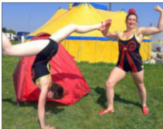
Les Polyamide Sisters ouvriront la troisième journée du festival « Tant qu'il y aura des mouettes », à 11 h 30, au Grand Pré de Langueux.

À 15 h, « Sans oublier les goélands », moment spontané de